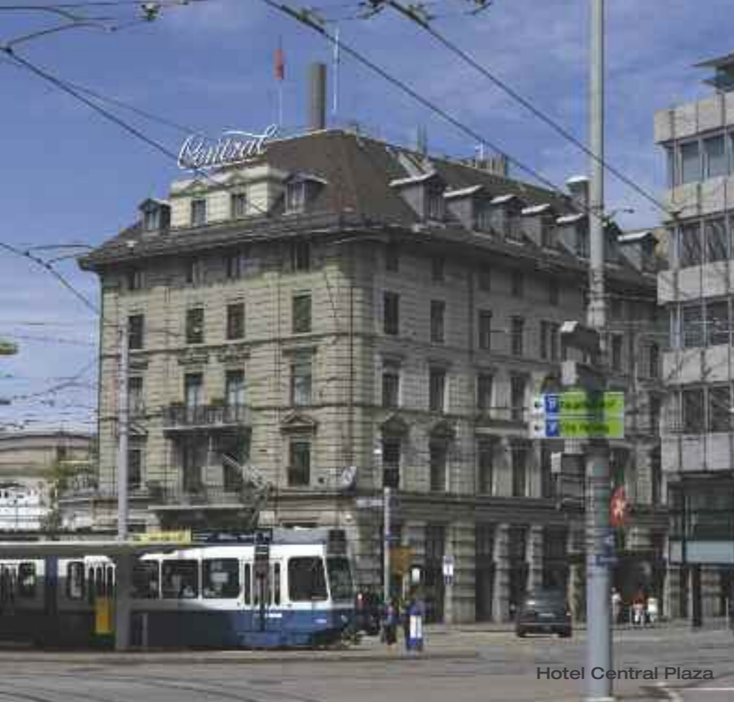
Hotel Central Plaza