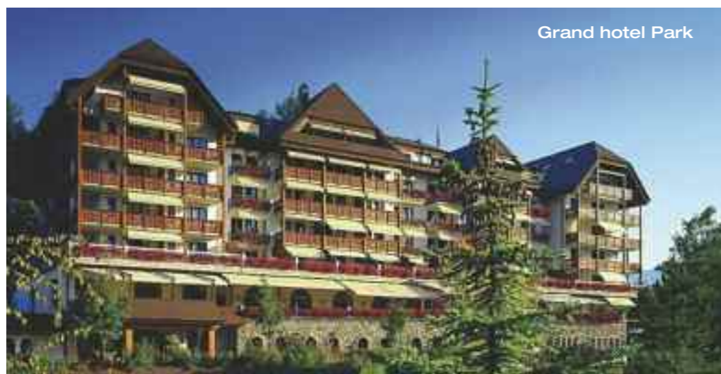
Grand hotel Park