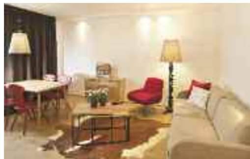
Zell am See

Ob für ein klassisches, rustikales, traditionelles, oder modernes Ambiente – wir haben das richtige Modell und die beste Lösung.